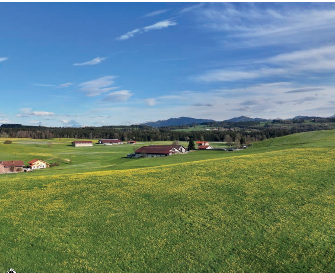
Regionale verschillen tussen Noord- en Zuid-Duitsland zijn ook zichtbaar. Het zuiden wordt gekenmerkt door melkveehouderij en gemengde landbouwstructuren.

ongeveer 22 miljoen ton samengesteld voer, Nederland 12 miljoen ton en België 7 miljoen (Fefac, 2023). De productiehoeveelheden zijn dus vergelijkbaar, maar die in de Benelux zijn veel meer exportgericht en dieper geïntegreerd. Nederland speelt een strategische rol, vooral als logistiek en grondstoffencentrum. Aanzienlijke hoeveelheden sojabonen, -meel en andere eiwitvoerproducten komen via de haven van Rotterdam Europa binnen. Een groot deel wordt verder de EU in getransporteerd. Duitse voederproducenten zijn daardoor indirect verbonden met de Noordzeehavens en handelsinfrastructuur. Belangrijke spelers in de industrie illustreren deze onderlinge verbondenheid. Bedrijven als ForFarmers, De Heus, Agrifirm en Ottevanger zijn internationaal actief en technologisch invloedrijk. Verscheidene van deze bedrijven exploiteren of leveren apparatuur in Duitsland, terwijl Duitse bedrijven zoals Agravis, BayWa en Bröring sterke handelsrelaties onderhouden met Benelux-partners. Machinefabrikanten en ingenieursbureaus werken ook over grenzen heen samen.